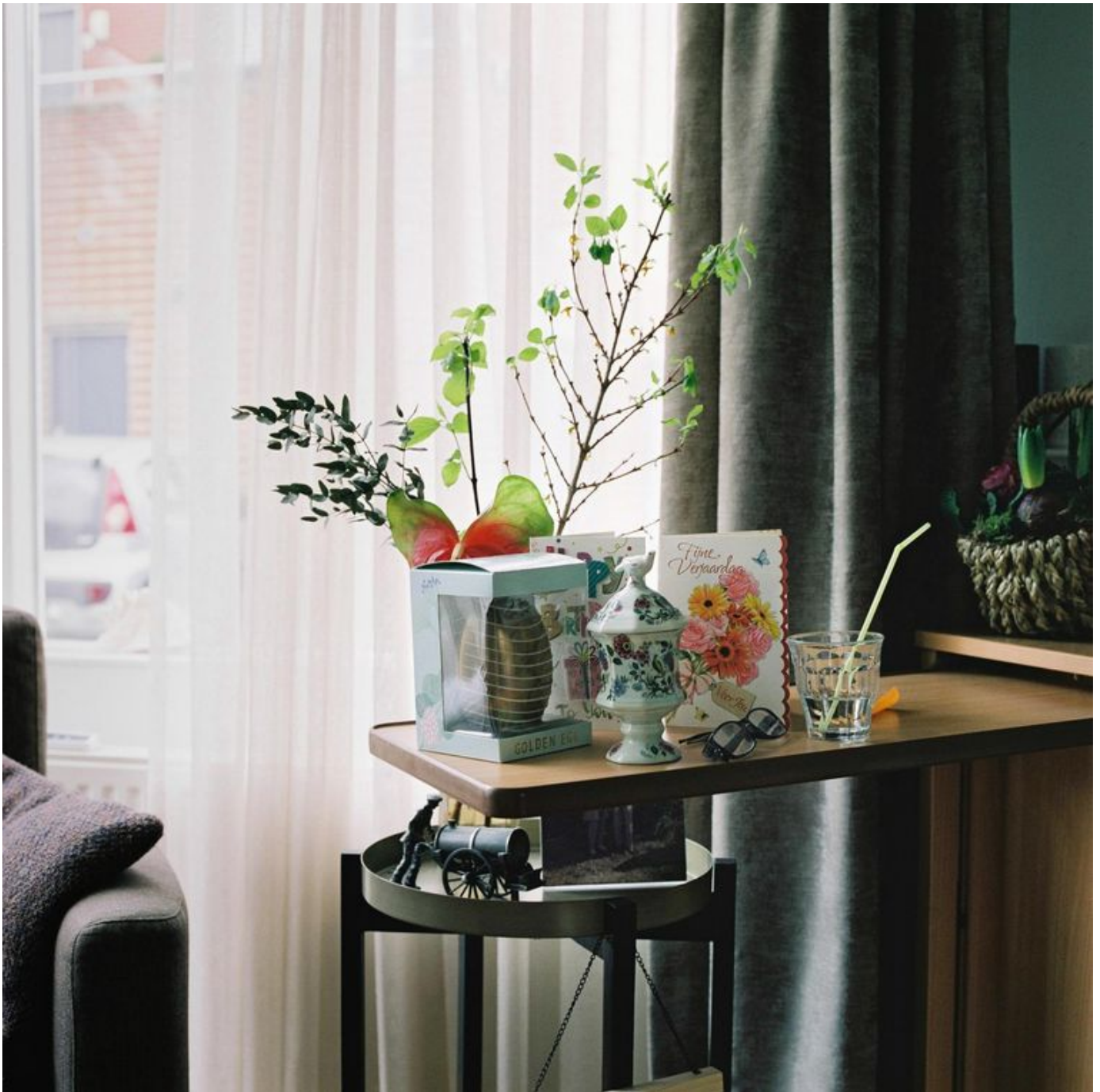
BEELD LOEK BUTER