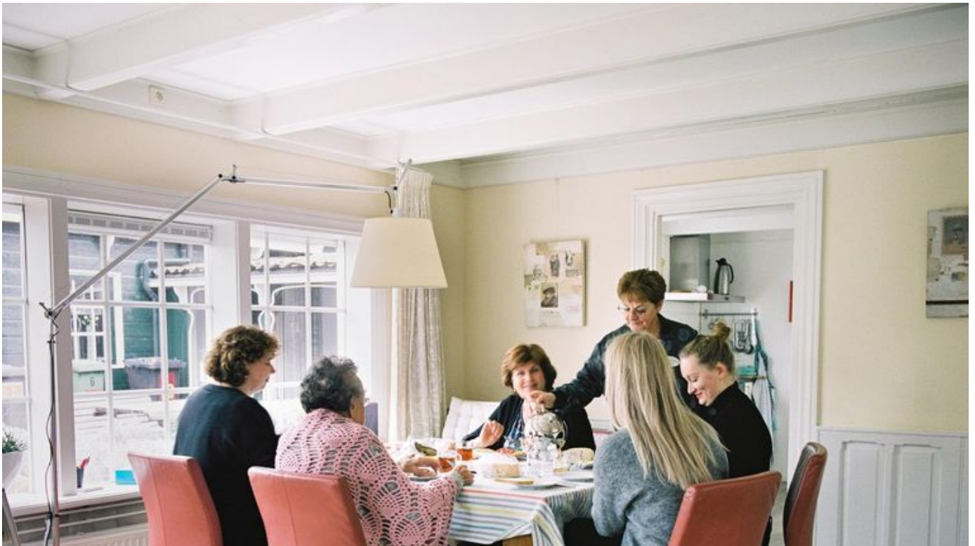
Hospice De Schelp